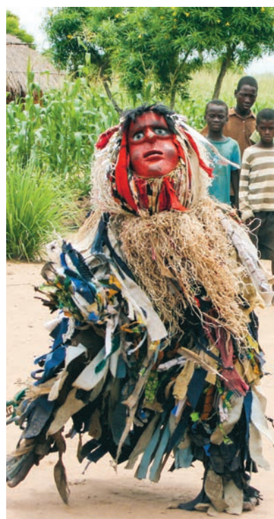
Traditionell dans i en av byarna.

– Inom We Effect har vi valt att arbeta nära lokala och regionala bondeorganisationer, som exempelvis Farmer Union, LRF:s malawiska motsvarighet. Genom att stärka deras kapacitet kan de i sin tur stärka bönderna. Det är en helt annan typ av hjälp och betydligt mer långsiktig än den hjälp som ges vid exempelvis en