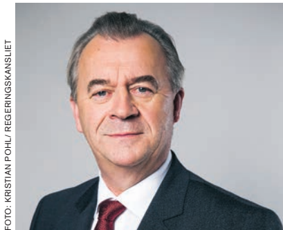
Sven-Erik Bucht, landsbygdsminister.

– Jag uppfattar också att landsbygdsministern har en tydlig ambition när det gäller att forma en livsmedelsstrategi