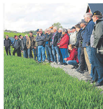
Fältvandringen i Bäddarö samlade hela 130 deltagare.

Under avslutande fikapausen fanns det sedan möjlighet att träffa kolleger och säljare, få en pratstund under gemytliga former medan solen sakta gick ner över fälten.